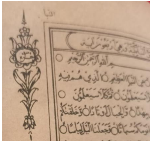
Gambar 2. Pias di awal Juz 30