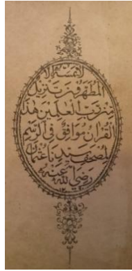
Gambar 5 Kolofon yang terdapat pada awal Mushaf

Kedua, kolofon dengan bahasa Arab di bagian bawah Surah An-Nas dan setelah doa Khotmil Qur'an, berbunyi: