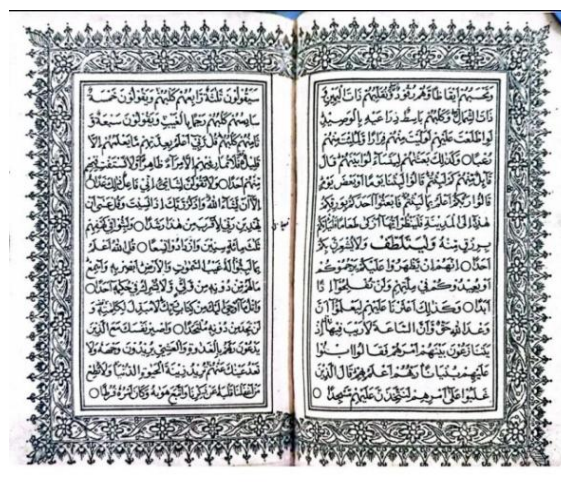
Gambar 4. Iluminasi pada Juz 15.

Adapun gaya iluminasinya mencerminkan pengaruh seni dekoratif Islami Ottoman, khusus dalam bentuk floral stilisasi atau arabesque atau pola berkelok-kelok yang biasa tampak pada mushaf Al-Qur'an kuno atau hiasan margin kitab klasik. Ilustrasi ini menggabungkan elemen simetri, detail floral yang rumit, dan elemen antropomorfik misalnya wajah pada bunga yang unik. Kemungkinan gaya tersebut digunakan sebagai penghias teks yang menampilkan estetika bernilai tinggi. Keindahan dari iluminasi di dalam mushaf al-Qur'an ini juga terdapat di halaman Surah al-Fatihah dan di awal Surah al-Baqarah. Naskah al-Qur'an dengan iluminasi seperti itu memang biasanya ditujukan bagi mushaf al-Qur'an kuno keagamaan, yang merefleksikan karya seni bernilai tinggi sekaligus dedikasi pada estetika dan spiritualitas.