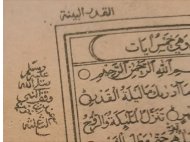
Gambar 3. Pias di pokok atas Surah al-Qadr.

Adapun gaya iluminasinya mencerminkan pengaruh seni dekoratif Islami Ottoman, khusus dalam bentuk floral stilisasi atau arabesque atau pola berkelok-kelok yang biasa tampak pada mushaf Al-Qur'an kuno atau hiasan margin kitab klasik. Ilustrasi ini menggabungkan elemen simetri, detail floral yang rumit, dan elemen antropomorfik misalnya wajah pada bunga yang unik. Kemungkinan gaya tersebut digunakan sebagai penghias teks yang menampilkan estetika bernilai tinggi. Keindahan dari iluminasi di dalam mushaf al-Qur'an ini juga terdapat di halaman Surah al-Fatihah dan di awal Surah al-Baqarah. Naskah al-Qur'an dengan iluminasi seperti itu memang biasanya ditujukan bagi mushaf al-Qur'an kuno keagamaan, yang merefleksikan karya seni bernilai tinggi sekaligus dedikasi pada estetika dan spiritualitas.