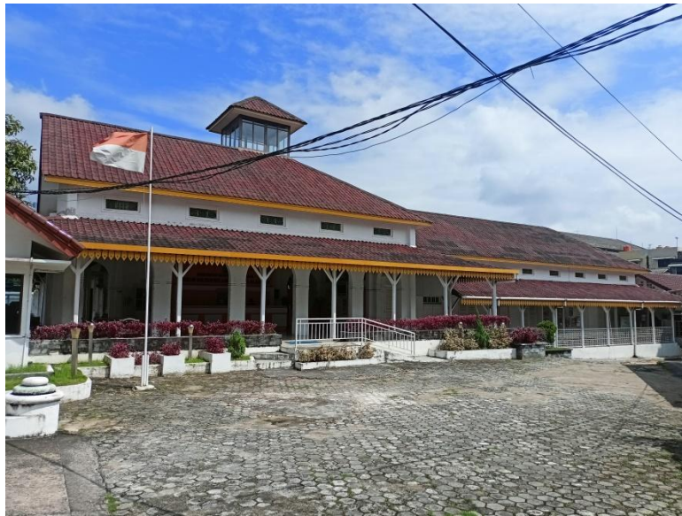
Gambar 1 Tampak Luar Museum

Museum Sultan Sulaiman Badrul Alamsyah di Tanjungpinang, Kepulauan Riau, merupakan museum budaya yang menyimpan dan memamerkan berbagai koleksi artefak bersejarah dan mencerminkan khazanah warisan budaya Melayu. Museum ini menempati bangunan yang pada zaman Hindia Belanda merupakan Sekolah Melayu Kelas Dua, yaitu Hollandsch-Inlandsche School (HIS). Sekolah dasar pertama di Tanjungpinang ini didirikan pada tahun 1918. Selama pendudukan Jepang, namanya diubah menjadi Futsuko Gakko (Kawasan Kepulauan Riau, 2009). Setelah Indonesia merdeka, gedung tersebut dikenal dengan nama Sekolah Rakyat (SR) dan kemudian menjadi SD 01 hingga tahun 2004. Karena kesadaran akan nilai sejarah dari gedung tersebut, maka Pemerintah Kota Tanjungpinang mengalihfungsikannya sebagai museum. Walikota Tanjungpinang, Suryatati A. Manan pada 31 Januari 2009 meresmikan museum tersebut sebagai Museum Sultan Sulaiman Badrul Alamsyah (Nurjali, 2025).